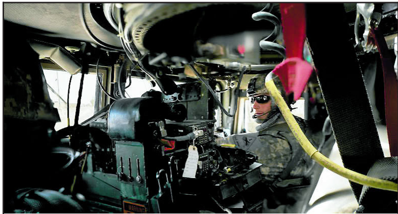
I IRAK: Amerikansk soldat i Sør-Irak.