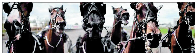
UTSOLGT: Dette hestebildet til 100 000 kroner pr. foto har McAlinden solgt seks stykker av.